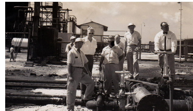
Tijdens de oorlog werd de vraag naar kerosine groter wat Eagle niet produceerde. Hierdoor is de raffinaderij buiten gebruik gesteld en na de oorlog gesloten.