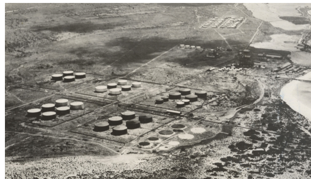
De raffinaderij besloeg op haar hoogtepunt het hele westelijk gelegen gebied naast oranjestad.