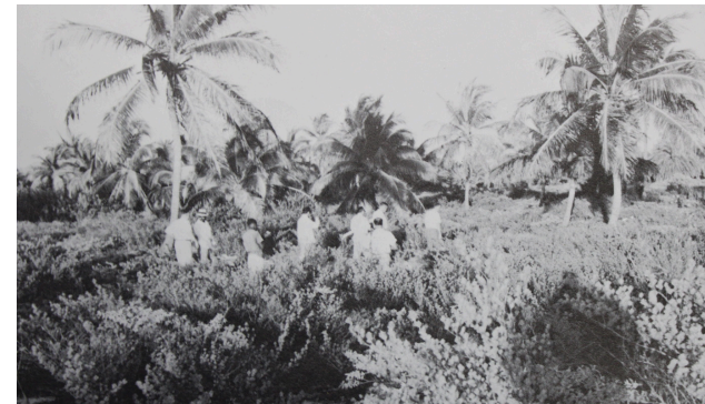
In 1957 begon een nieuw tijdperk in Aruba. Toerisme kwam op. Op de foto de eerste zoektocht naar de plek voor een nieuw resort.