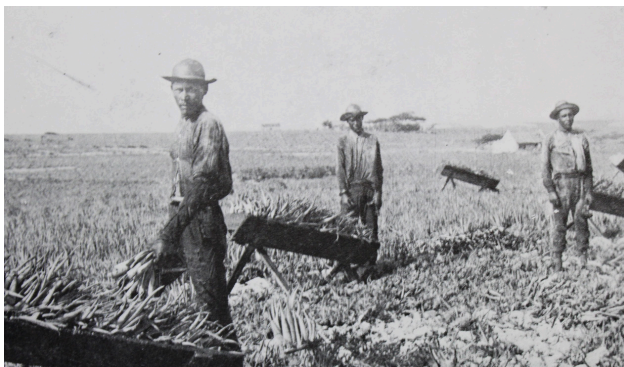
Voor de komst van de Arend Petroleum Maatschappij leefde de inwoners van Aruba vooral van de visserij, praktisch het enige dat plaatsvond op en rond het eiland.