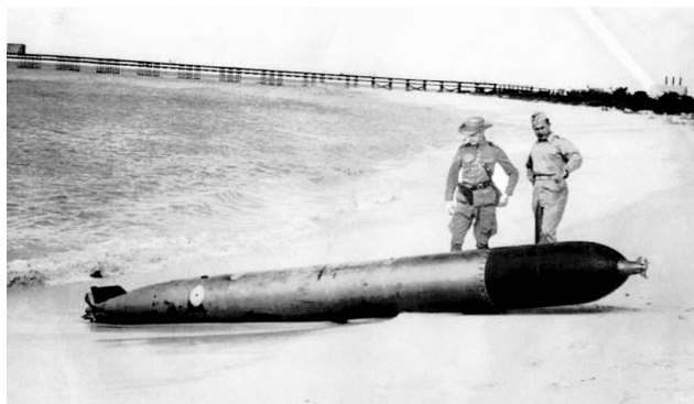
Aruba was tijdens de WO II de grootste olie verwerker van de wereld. De Duitsers hebben alleen deze streek aangevallen van heel het westelijk halfrond.