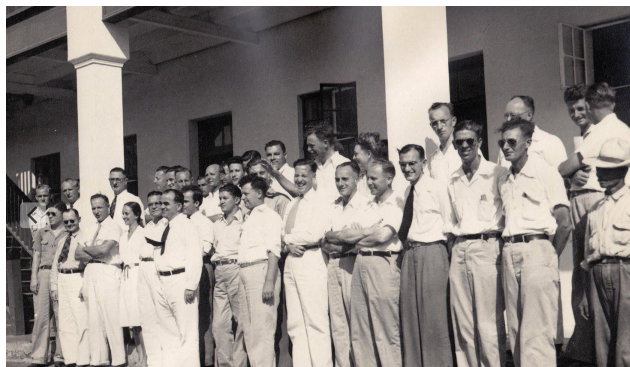
De staff op de foto voor het hoofdkwartier van de olieraffinaderij.