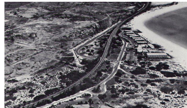
Op de foto is te zien hoe de eerste resorts al aan de kust zijn gebouwd terwijl de laatste tanks, land inwaarts gesitueerd, er nog staan. Zo snel als dat Eagle kwam is het ook weer weg gegaan.